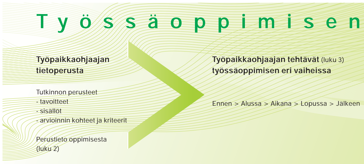
Kuvio 1. Työssäoppimisen ohjaamisen kokonaisuus.